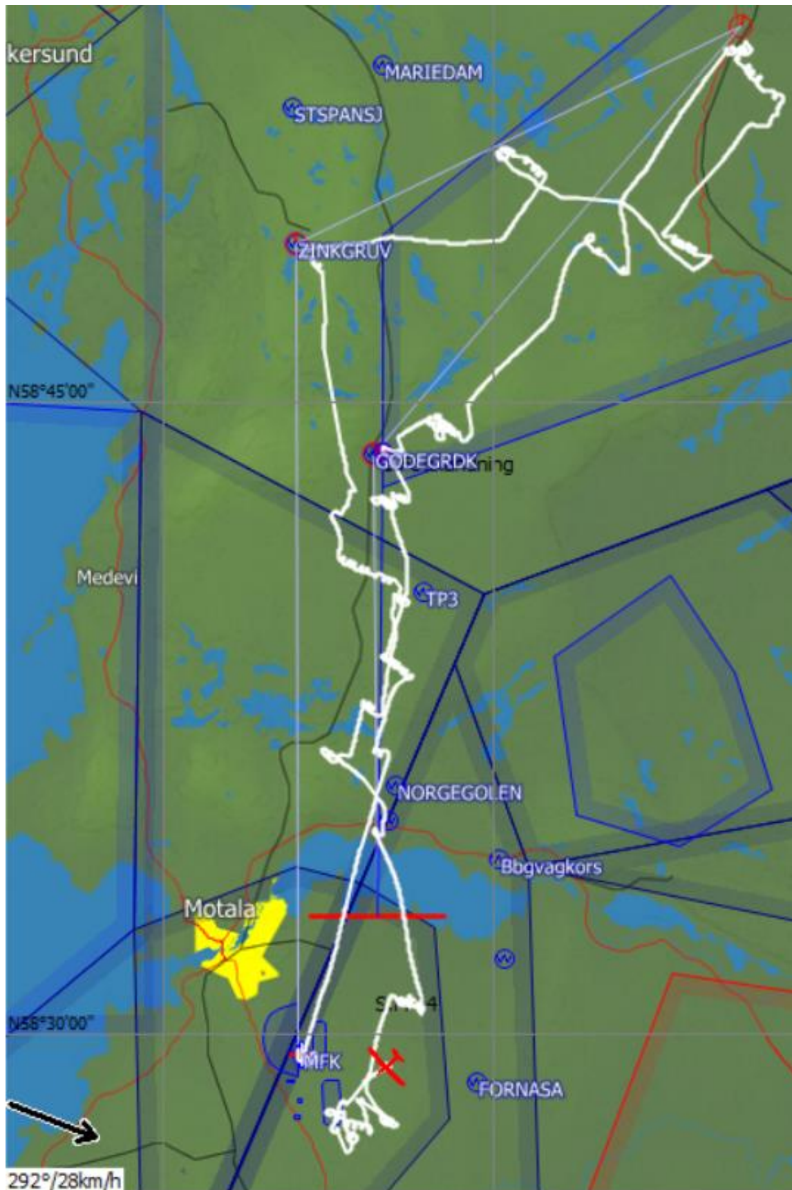
Niclas flygning i Pilatus